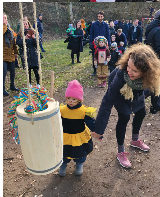
Glade kattekonger og -dronninger.