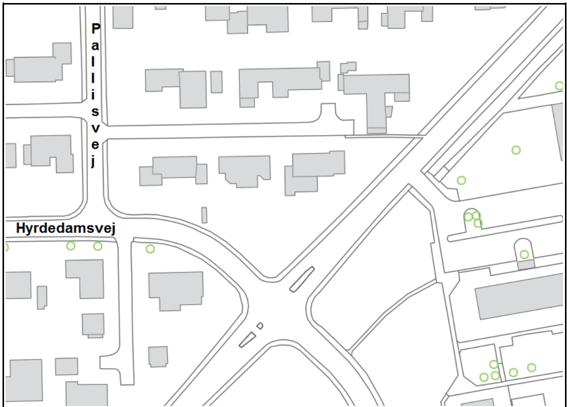
Figur 1. Krydset Hyrdedamsvej/Hejredalsvej/Sigridsvej som det ser ud i dag.