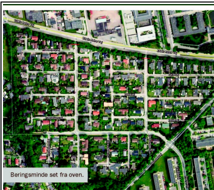
Beringsminde set fra oven.