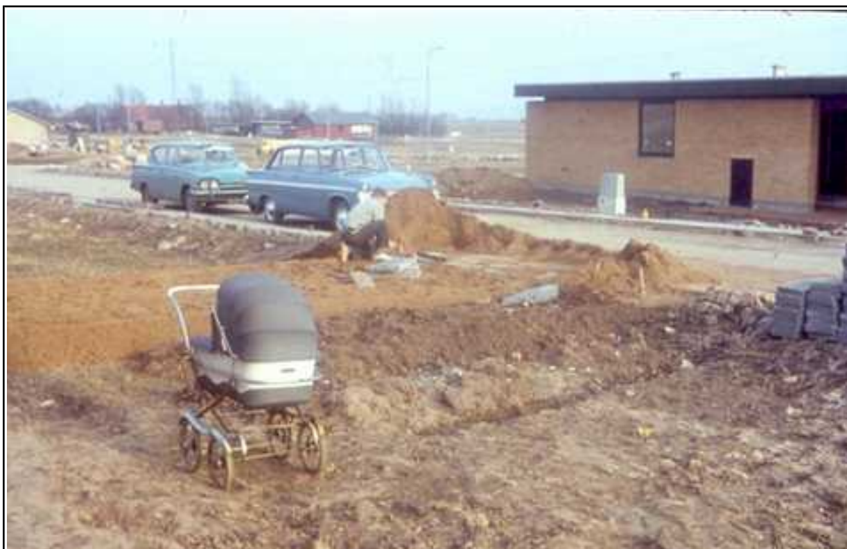
Billedet er fra byggegrunden Hvedebjergvej 82 omkring 1964. Huset på modsatte side er Hvedebjergvej 98. I baggrunden (over de to biler) ses i røde mursten Hyrdedamsvej 15, og gården Beringsminde, der har lagt navn til vores område.